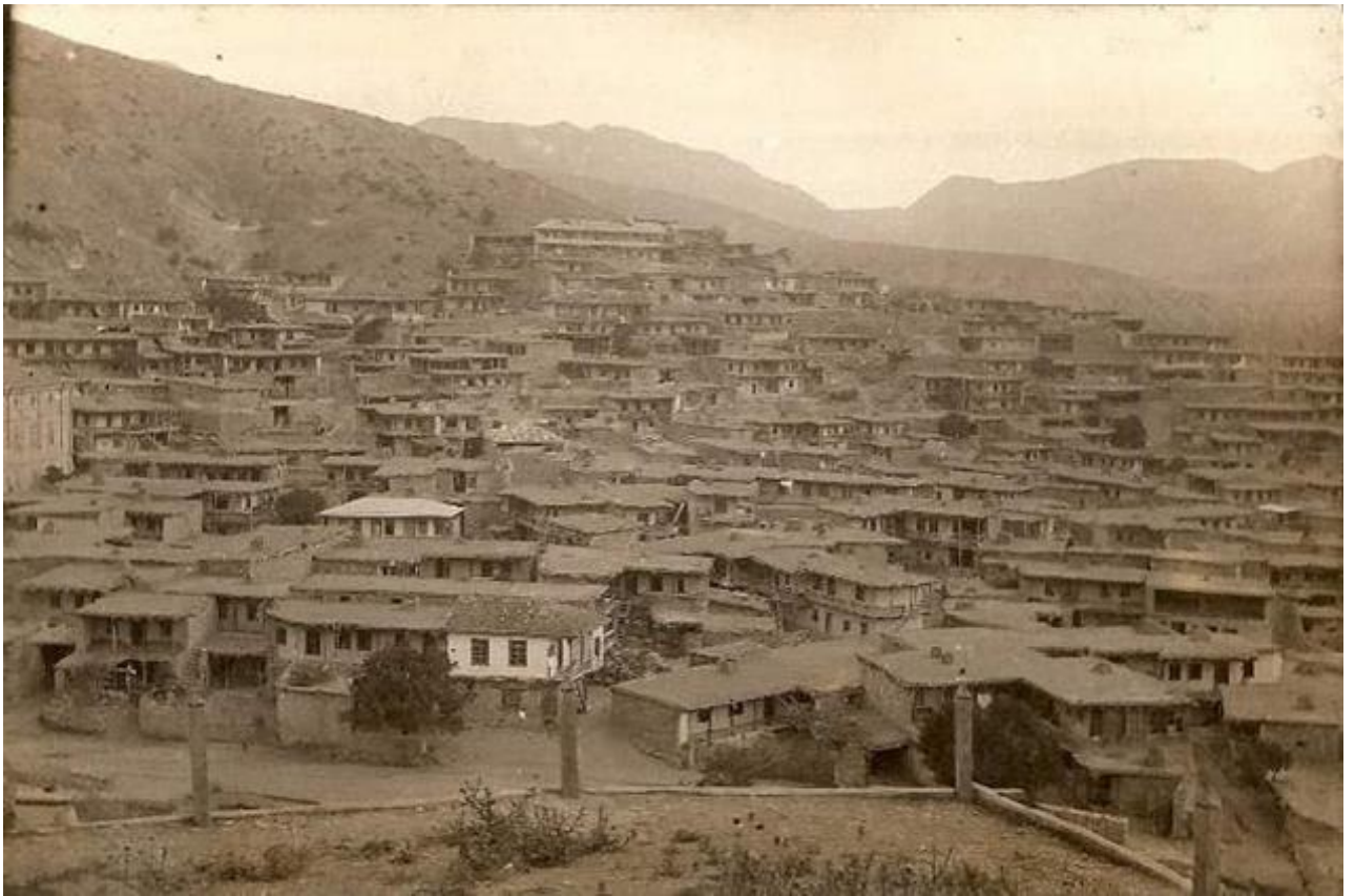
Спорожніле кримськотатарське село Ускют в 1945 р.

https://upload.wikimedia.org/wikipedia/commons/6/67/Uskut.jpg?download