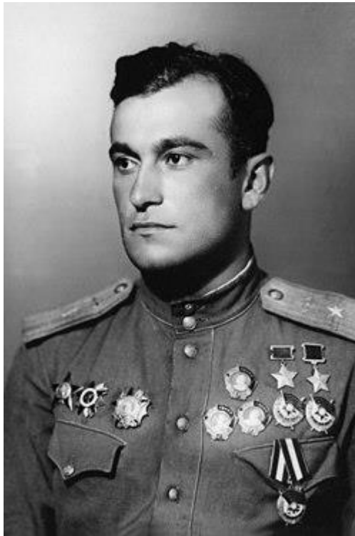
Амет-Хан Султán (1920-1971)

Звичайно, хтось з кримських татар міг потрапити до німецького полону або утекти з війська додому, особливо коли Червона армія 1941-го залишала півострів – такі випадки траплялися і серед людей різних національностей, – але карати за це всіх?..