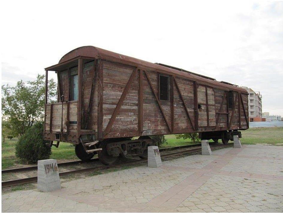
У таких вагонах депортували з Криму. https://prm.ua/wp-content/uploads/2020/05/Vagon-teplushka.jpg

Щоб передчасно не розголошувати підлеглим справжні наміри, в наказі поставили завдання очистити Крим «від агентів шпигунських резидентур німецьких та румунських розвідувальних органів» – одразу й не здогадаєшся, про що йдеться.